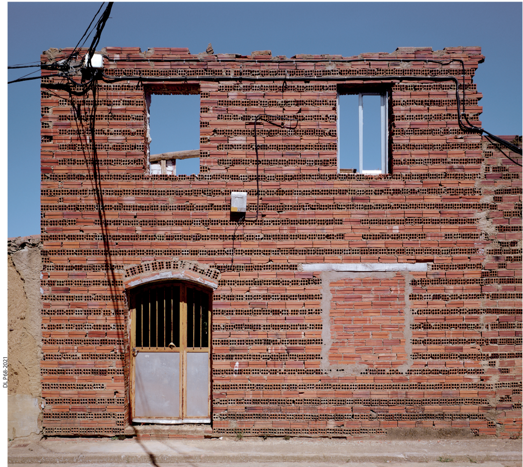
© Javier Ayarza. S/T, proyecto "La siesta del Fauno"; 128x148,5 cms; 2003. (Colección Musac)

Campos. Ana Frechilla "Intervalo lúcido. Consciencia del espacio" 6 de junio/30